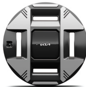
19-Zoll-Leichtmetallfelgen (optional für Earth)