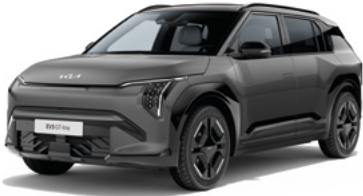
Schiefergrau Met. (EBD)