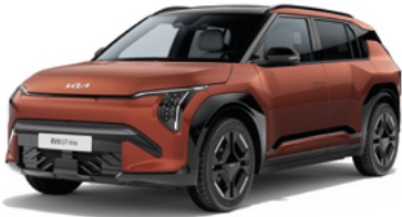
Terracotta Met. (TCT)