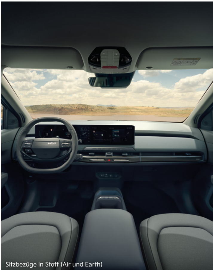
Sitzbezüge in Stoff (Air und Earth)