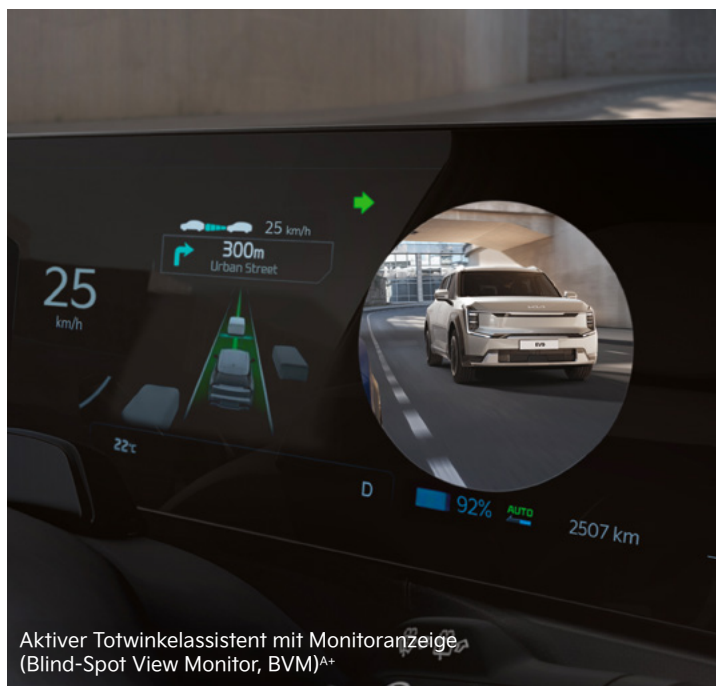
Aktiver Totwinkelassistent mit Monitoranzeige (Blind-Spot View Monitor, BVM) A+

Mit einem breiten Spektrum an aktiven Sicherheitssystemen A unterstützt dich der Kia EV3 dabei, in Gefahrensituationen schnell und angemessen zu reagieren.