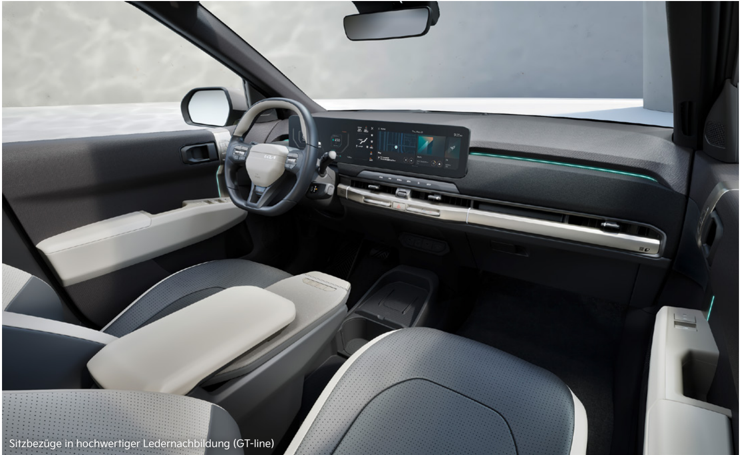
Sitzbezüge in hochwertiger Ledernachbildung (GT-line)

Progressives Design, viel Platz für bis zu fünf Reisende, clevere und zukunftsweisende Technologien – der vollelektrische Kia EV3 wird dich auf jeder Fahrt inspirieren.