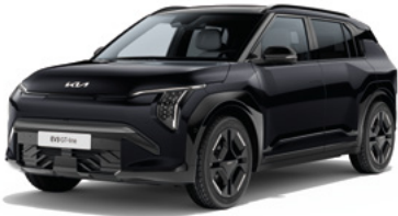
Auroraschwarz Met. (ABP)