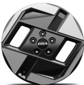
17-Zoll-Leichtmetallfelgen (Serie für Air & Earth)

Bei einigen unserer modernen Metallicfarben werden bewusst unterschiedliche Farbpigmente verwendet. Dadurch können unter bestimmten Lichtverhältnissen, z. B. direktes Sonnenlicht, attraktive Farbeffekte erzielt werden. Zum Teil kann die Farbe changieren, z. B. von Schwarz zu Dunkelblau. Bei den hier abgebildeten Farbdarstellungen kann es aufgrund der Drucktechnik zu Abweichungen zu den Originalfarben kommen. Weitere Informationen zu den Farbeffekten und Grundfarben erhältst du bei deinem Kia-Partner. Metalliclackierungen sind aufpreispflichtig.