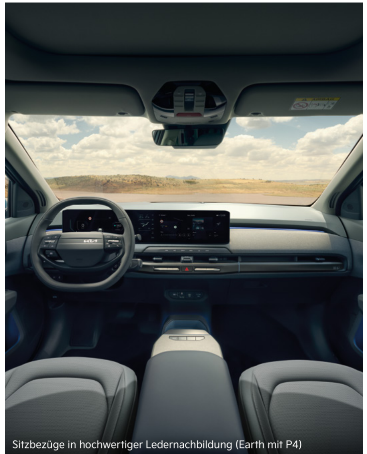
Sitzbezüge in hochwertiger Ledernachbildung (Earth mit P4)