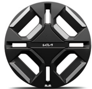
19-Zoll-Leichtmetallfelgen (Serie für GT-line)