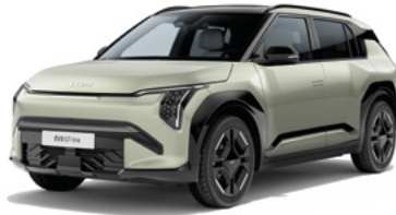
Aventurin Grün Met. (AG3)